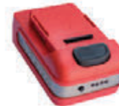
Li-İon 14,4 V Akü 7500361114