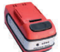
Li-İon 18 V Akü 7500361118